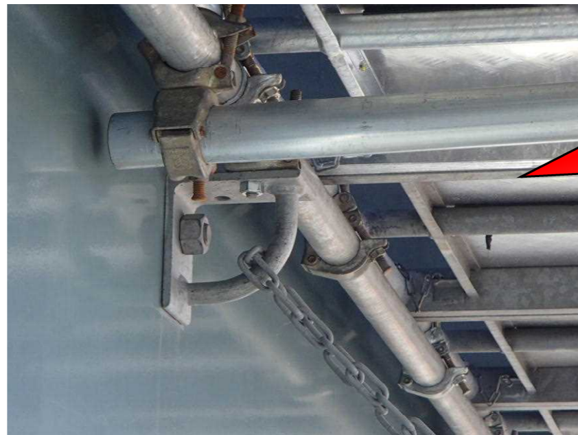
下段足場孔へのカーリング設置状況