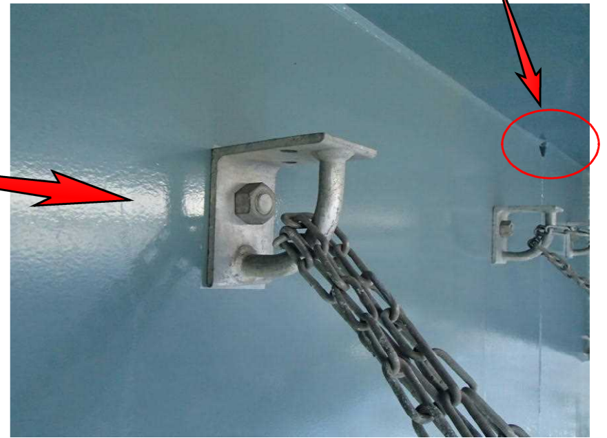
上段足場孔へのカーリング設置状況